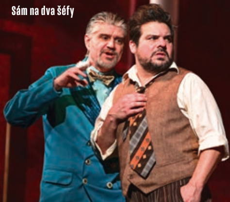
Sám na dva šéfy