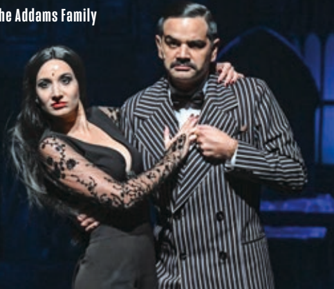
The Addams Family